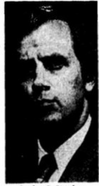
H. R. Haldeman Headed White House staff